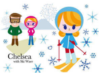
ニセコキャラクタープロジェクト