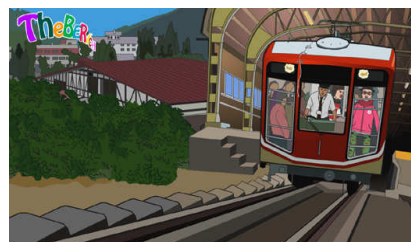
富山観光アニメプロジェクト